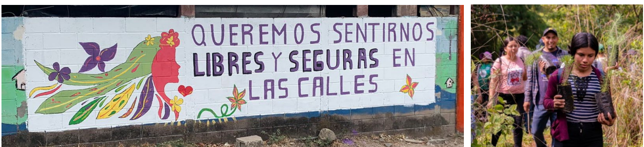
Fotos: Kampagnen im Gender- und Umweltbereich.

Das Programm für Nachhaltigkeitsbildung in Morazán hat im vergangenen Jahr erneut erfolgreich dazu beigetragen, das Bewusstsein für soziale und ökologische Probleme zu schärfen und lokal getragene Lösungen dafür zu finden. Insgesamt konnten 700 Personen von 36 Organisationen direkt durch die Bildungsaktivitäten des Programms erreicht werden. Durch die grossangelegten Kampagnen und die Projektunterstützungen im praktischen Teil sowie die Vernetzungsarbeit konnten die vermittelten Inhalte und Instrumente nicht nur von den Teilnehmenden, sondern auch von breiten Kreisen der lokalen Bevölkerung genutzt werden.