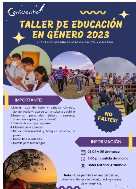
Foto: Flyer für einen Genderworkshop